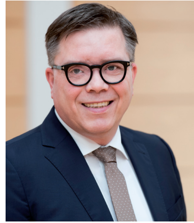
Ulrich Heckmann, Bürgermeister